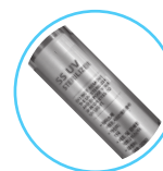
4° lampa UV sterylizator