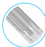
2° membrana osmotyczna RO