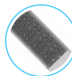
3° wkład węglowy szlifujący